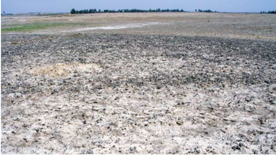
على هذه الأرض كانت إمارة بني مزيد ماثلة للعيان.. وأصبحت اليوم آثاراً

ولد بالنيل سنة ٥٩١ هـ وانتقل إلى الحلة، واشتغل فيها على عميد الرؤساء. أجمع المؤرخون على أنه كان عالماً، فاضلاً، يحب العلماء ويسدي إليهم المعروف، وكانت بينه وبين حاشية الخليفة مشاحنة فنسبوا إليه الخيانة في وقائع المغول واتخذوها وسيلة للوقيعة فيه، كما نسب إليهم محاولة خلع الخليفة. وقد نقل عن الطقيطي صاحب كتاب الفخري (كان مؤيد الدولة عفيفاً عن أموال الديوان وأموال الرعية، متزهاً مترفعاً، وكان خواص الخليفة يكرهونه ويحسدونه بينما كان الخليفة يعتقد فيه ويحبه، لذا أكثروا من الذم له عند الخليفة، فكف يده عن أكثر الأمور ونسبه الناس أنه خامر أي اتفق سراً مع أعداء الخليفة على إزاحته وليس ذلك بصحيح) ثم يذكر (ومن أقوى الأدلة على عدم مخامرته، سلامته في هذه الدولة أي