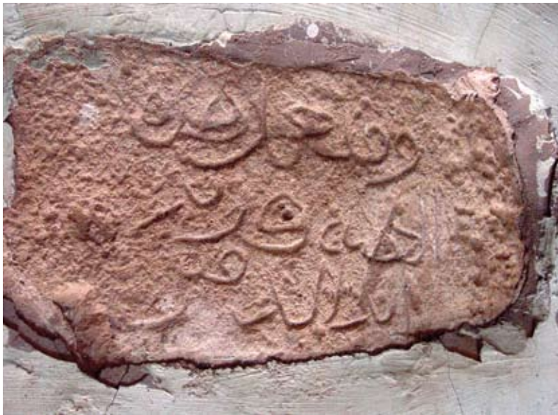
صخرة منقوشة لقبر سيد مجهول تنتظر من يكشف رموزها

بالنسبة لقطاع التربية والتعليم، أيضاً يعاني هذا القطاع من قلة تجهيزه بالمواد الضرورية لإدامة العملية التعليمية في النيل، يبلغ عدد المدارس ثلاث وعشرون