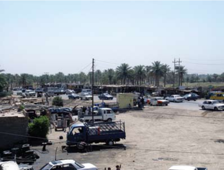
منظر عام لمركز المدينة

أما العشائر فإضافة لما ذكرناهم ضمن القرى، فهناك عشائر زبيد وشمّر والأحباب وآلبو نافع (الندة). كذلك هناك عدد من الأسر الحسينية والموسوية مثل آلبو عنة والسادة آل ياسر، إضافة لعشيرة العمّار