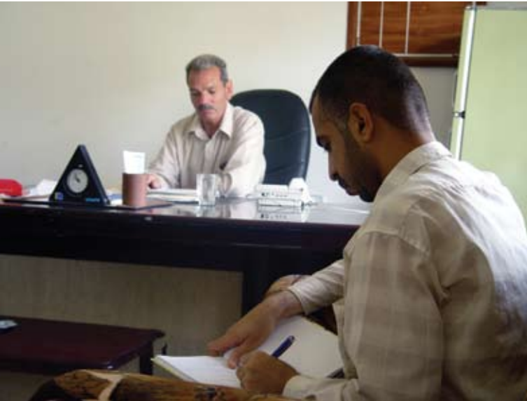
يظهر في الصورة السيد مدير ناحية النيل

ثم تلاه في إمارة ولده نور الدولة دُبَيْس بن علي بن مزيد، الذي امتدت مدة حكمه لإمارة النيل ما يقارب ٦٦ سنة من عام ٤٠٨هـ إلى عام ٤٧٠هـ، وقد دارت بينه وبين أخويه المقلد وثابت الحروب والفتن، فقد اتفقت خفاجة معها، فأغاروا على النيل وعاثوا فيها فساداً إلا أن دُبَيْساً كان ذا دهاء وسياسة،