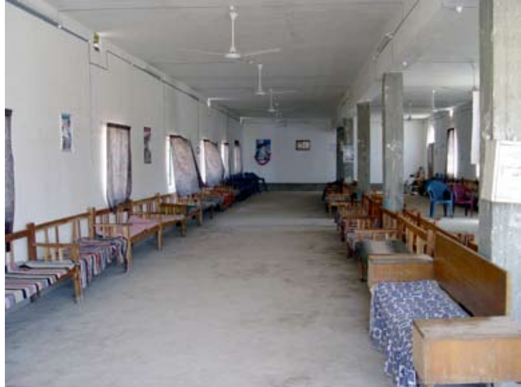
القاعة التي تقام فيها الدورات التثقيفية الصيفية