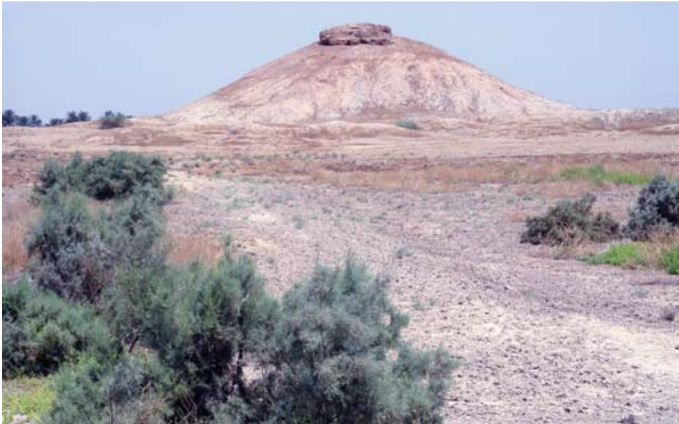
تل الاحيمر الأثر الباقي من حضارة كيش والذي لم يكتشف باطنه بعد؟!

عند إلقاء نظرة فاحصة على خارطة مدينة النيل نلاحظ الموقع المتميز الذي حظيت به هذه المدينة فمدينة كيش التاريخية ذات التاريخ العريق والحضارة الأصيلة تلاصقها ويظهر تل الأحيمر الذي حدثنا عنه بعض سكان مدينة النيل في كونه يُعد أسطورة يقول فحواها (إن تل الإحيمر يغطي سفينة من ذهب 19) كما أن الأكمات والتلاع تحيط بهذا التل وقد سُوِّجت هذه المنطقة بكاملها باعتبارها تابعة لمديرية الآثار، فكل أكمة تعني وجود سرٍ تحتها، لا يكشفه سوى التنقيب والبحث كما اكتشفت بالصدفة مقابر