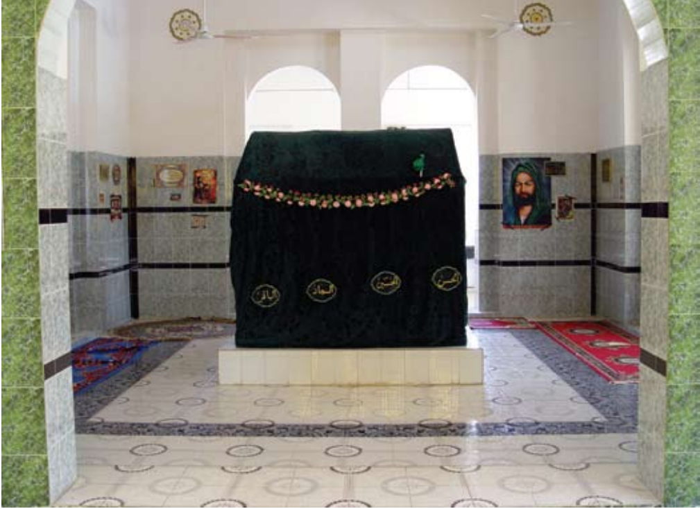
مرقد موسى بن الحسن المثنى عليه السلام

يطلب منه تعمير القبر ويقول له أنا من عترة النبي ﷺ، فاستيقظ وقرر بناء حجرة تضم القبر، وأما بالنسبة لتعيين القبر فقد ذهبنا بالصخرة لشخص متعلم حينها وكلنا هنا أميون، فقرأها بصورة عشوائية وقال هو معد بن علي الهادي عليه السلام، وقد كانت تعرف من قبل بمقام الخضر عليه السلام (وقد طلب الحاج عبيس منا إيصال صوته لكل من له شأن في اكتشاف الخطوط وتعيينها لكي تتم معرفة هذا السيد الجليل).