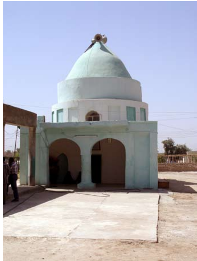
مرقد سعد وسعيد ابني جابر الأنصاري المركز الرئيس لتجمع أبناء المدينة